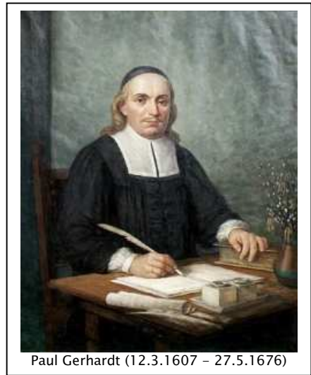
Paul Gerhardt (12.3.1607 – 27.5.1676)